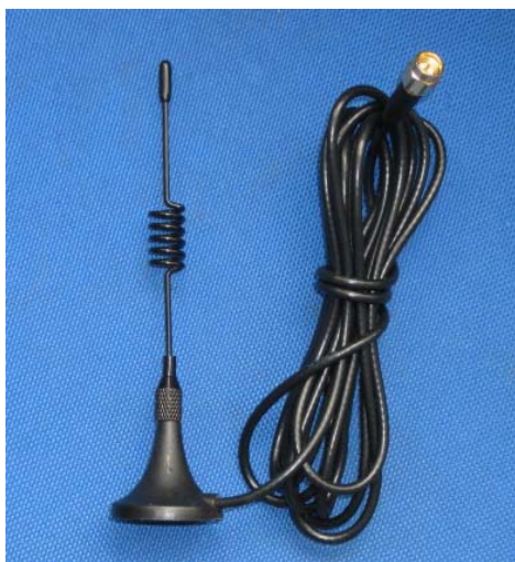
图 7 ANT120-1M485A